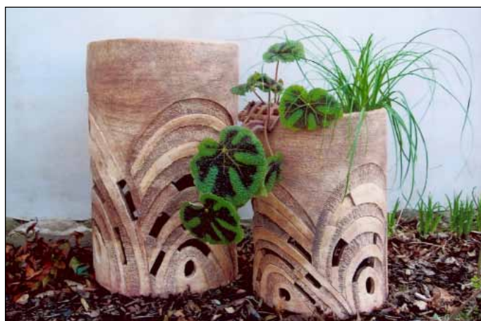
Párové předměty posilují oblast partnerských vztahů.

Pronikání východních nauk do západních zemí probíhá v mnoha směrech, nevyhnulo se ani bydlení. Tuto oblast života zkoumá Feng Shui – tradiční čínské umění a věda o životě v harmonii s okolním prostředím. Mohou být i pro nás použitelné a užitečné poznatky z druhého konce světa staré čtyři tisíce let?